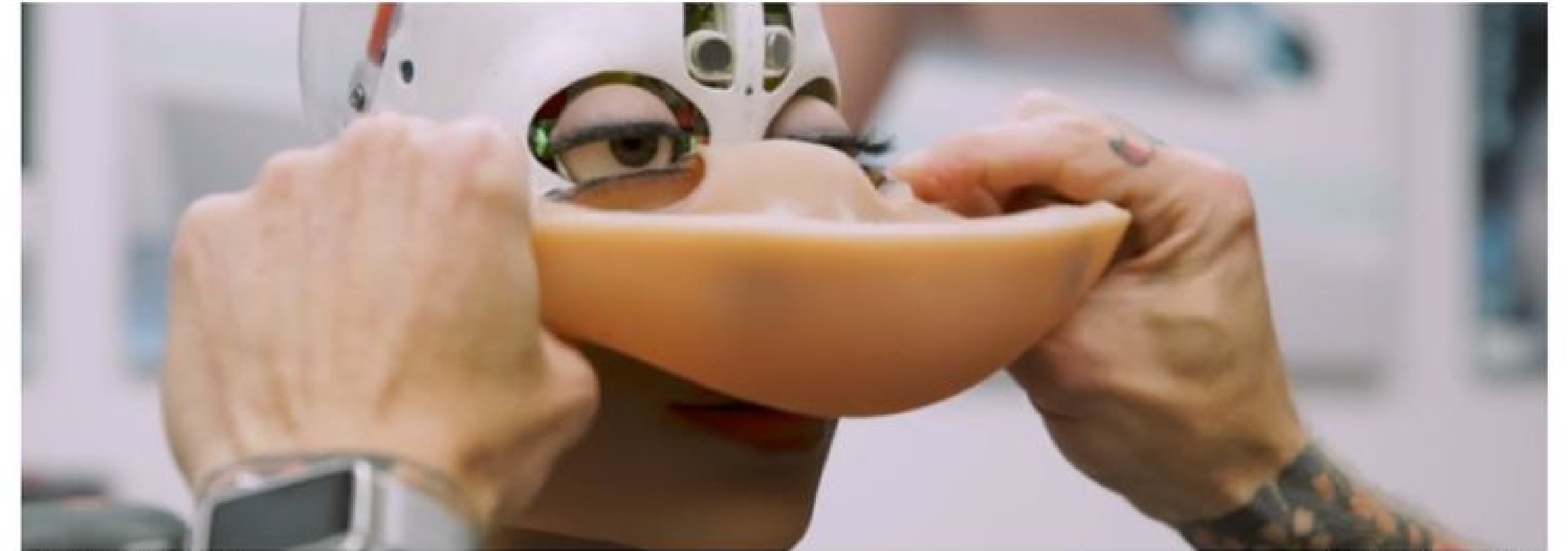
性愛機械人的真面目