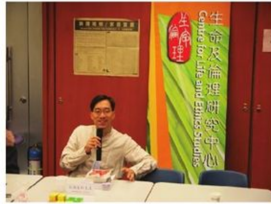
家和指出每間教會有其獨特氣質，亦有不同類型的會眾，因此每間教會的界線都不同。